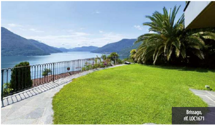
Brissago, rif. LOC1671