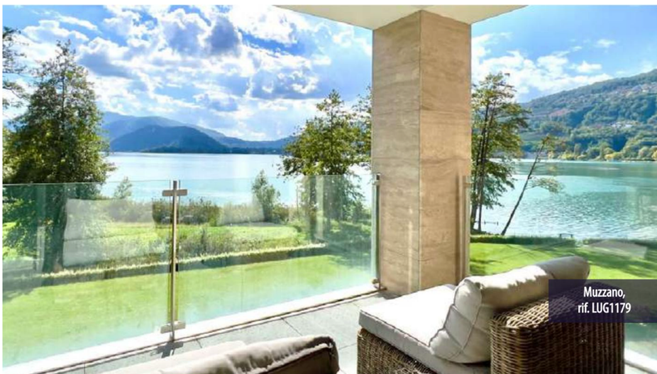
Muzzano, rif. LUG1179