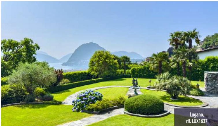
Lugano, rif. LUX1637