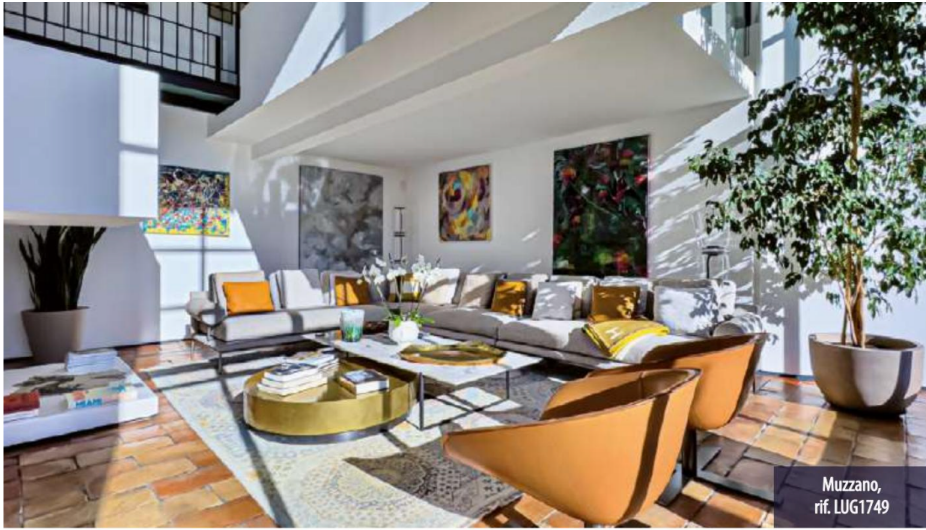
Muzzano, rif. LUG1749