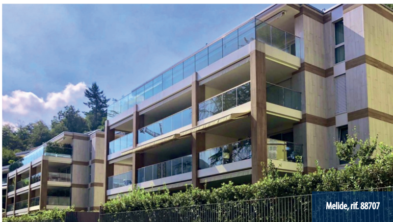
Melide, rif. 88707