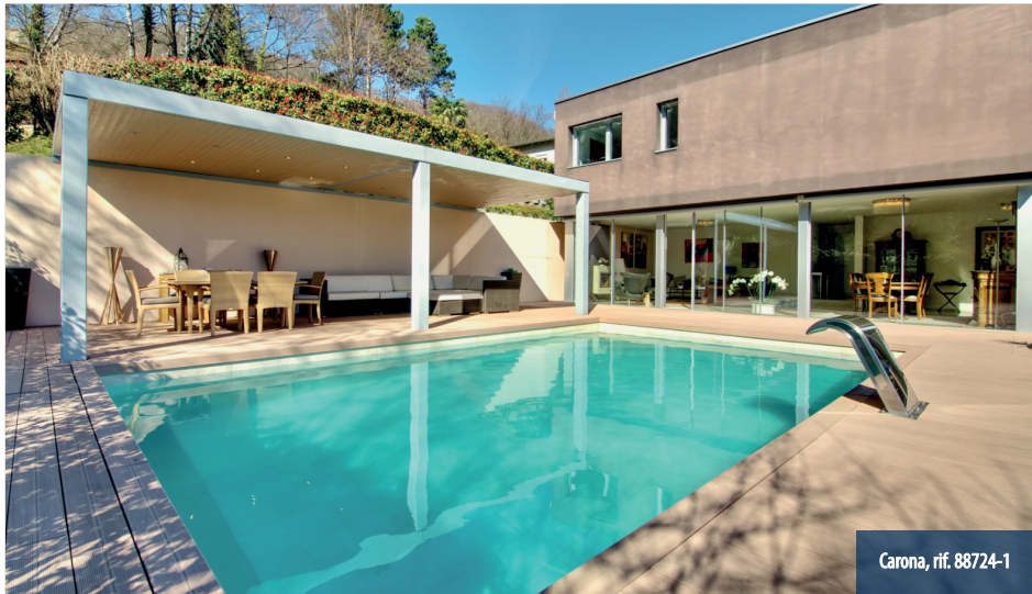
Carona, rif. 88724-1