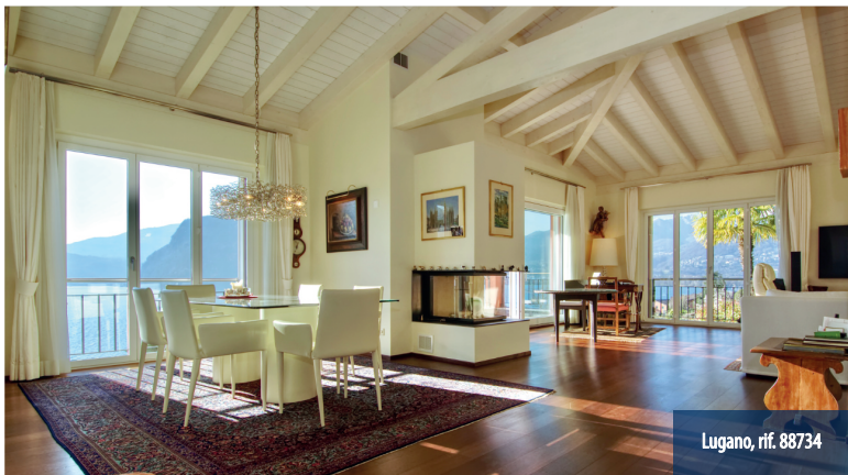
Lugano, rif. 88734