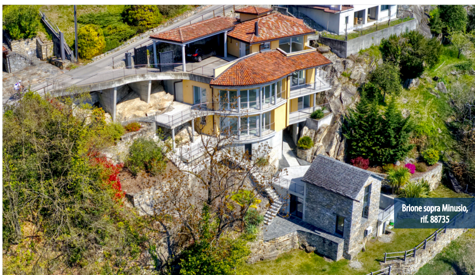
Brione sopra Minusio, rif. 88735