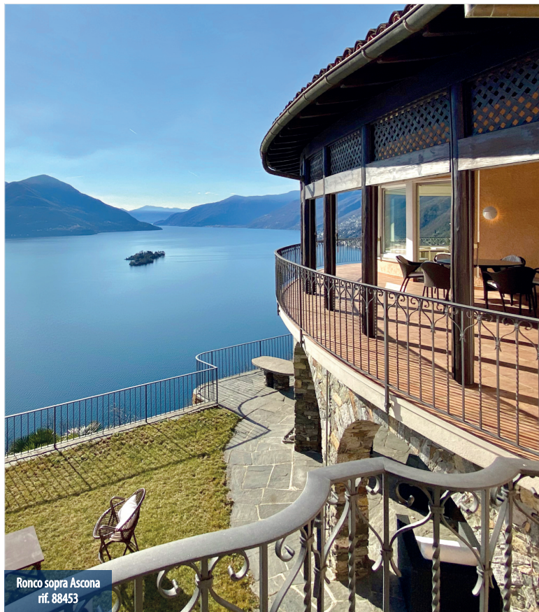
Ronco sopra Ascona rif. 88453