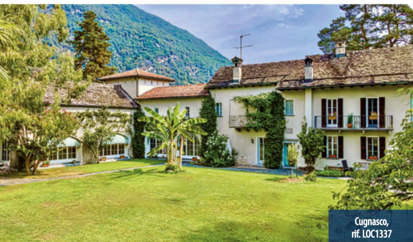
Cugnasco, rif. LOC1337