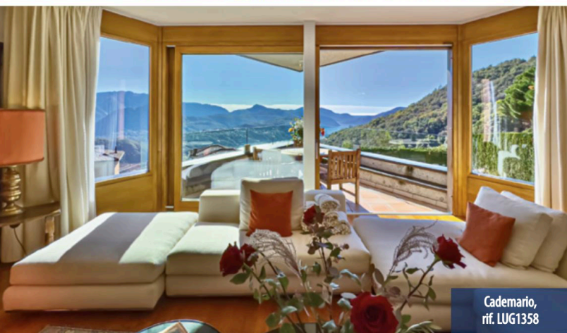
Cademario, rif. LUG1358