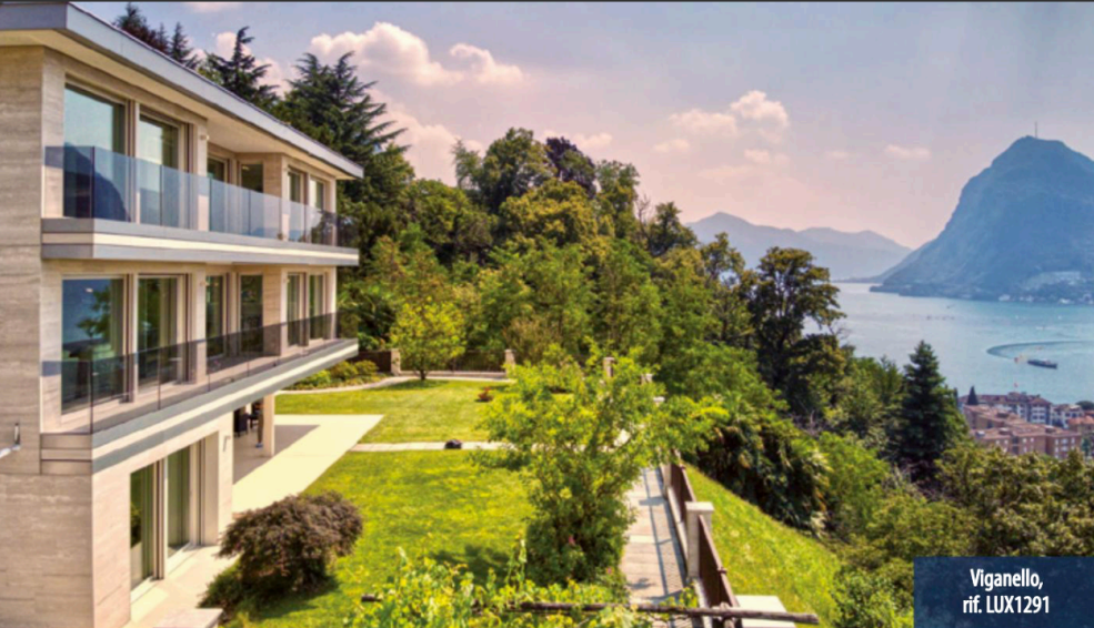
Viganello, rif. LUX1291