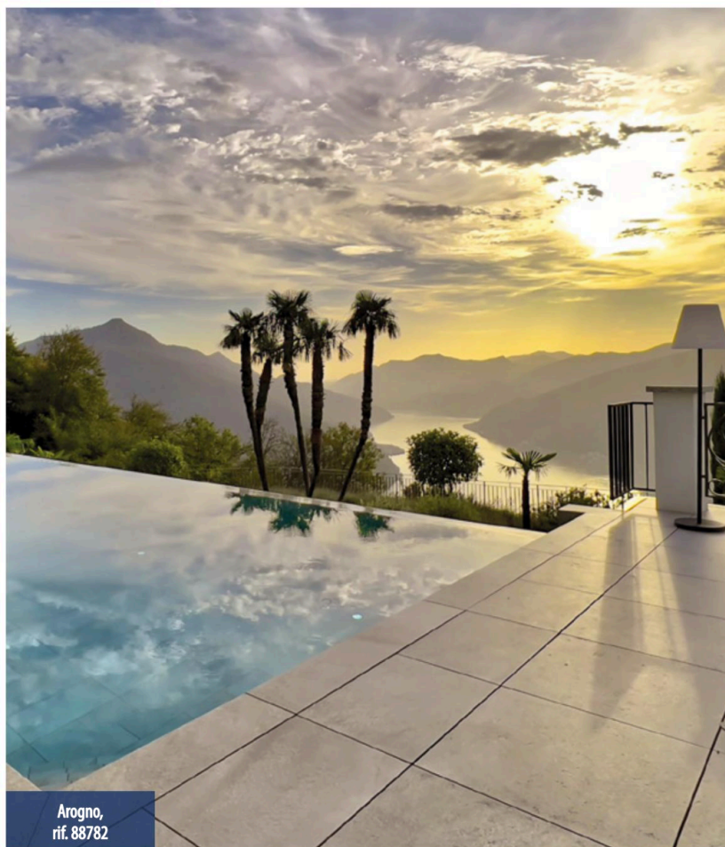
Arogno, rif. 88782