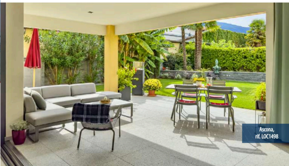
Ascona, rif. LOC1498