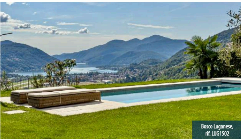
Bosco Luganese, rif. LUG1502