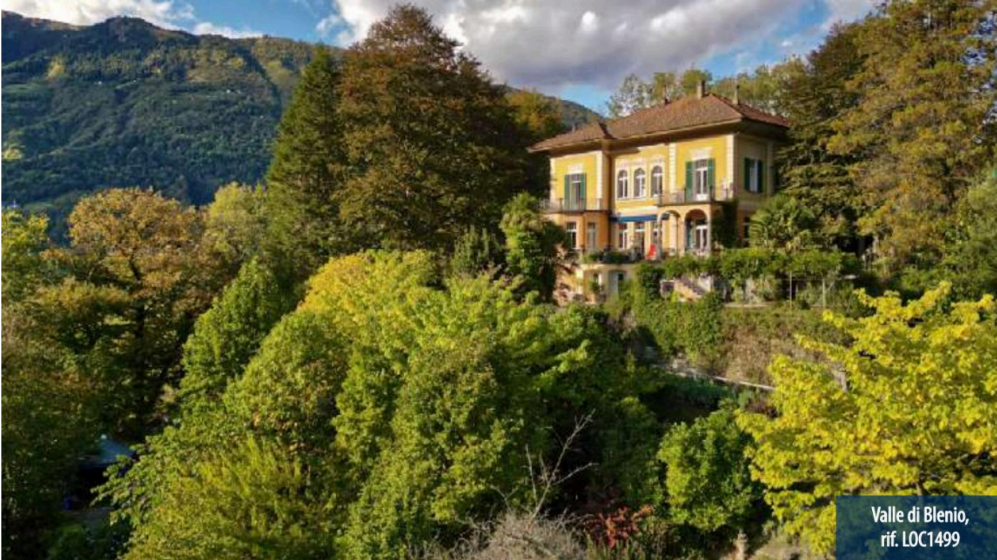
Valle di Blenio, rif. LOC1499