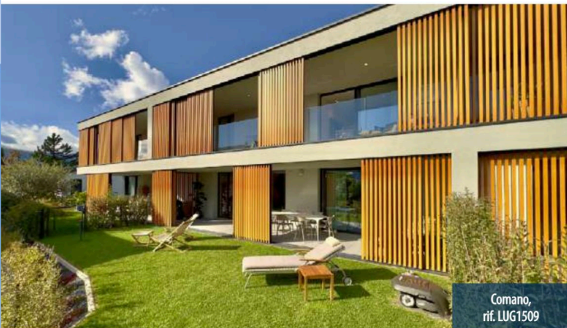
Comano, rif. LUG1509