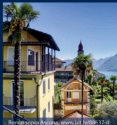
Ronco sopra Ascona, www.bit.ly/88637-it