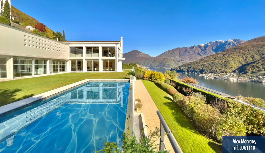
Vico Morcote, rif. LUG1110