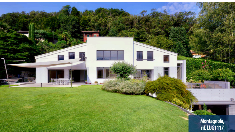
Montagnola, rif. LUG1117