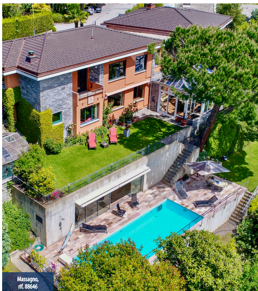
Massagno, rif. 88646