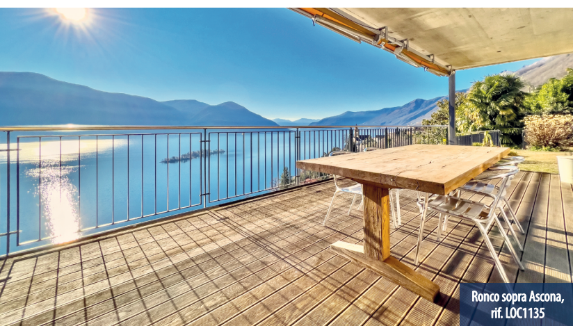
Ronco sopra Ascona, rif. LOC1135