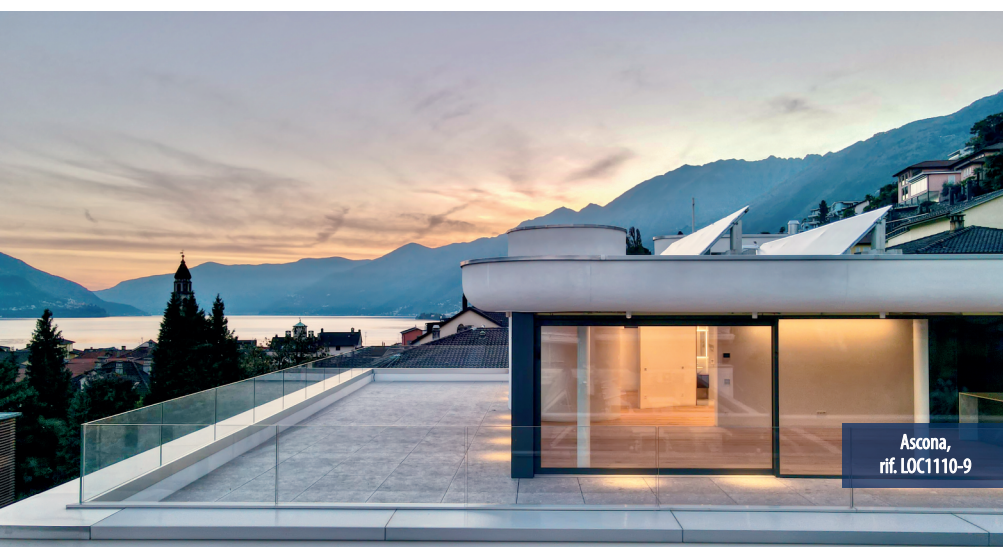
Ascona, rif. LOC1110-9